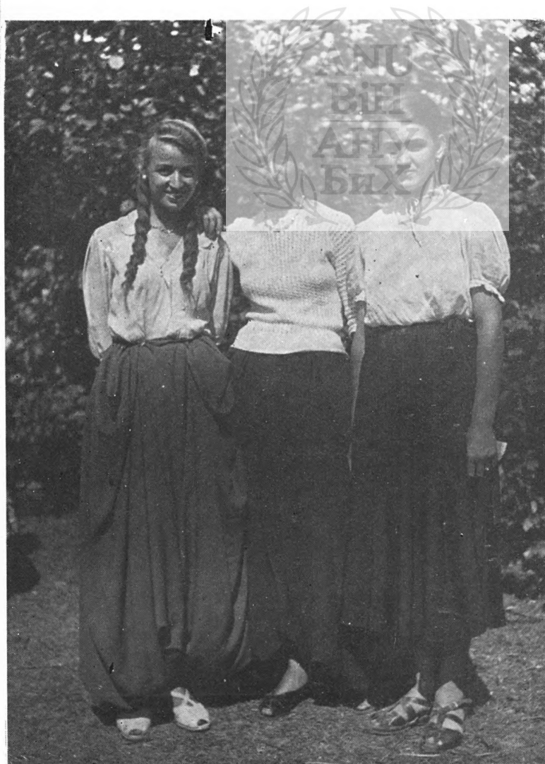
Sl. 2. Hrvatska devojačka nošnja, Borna