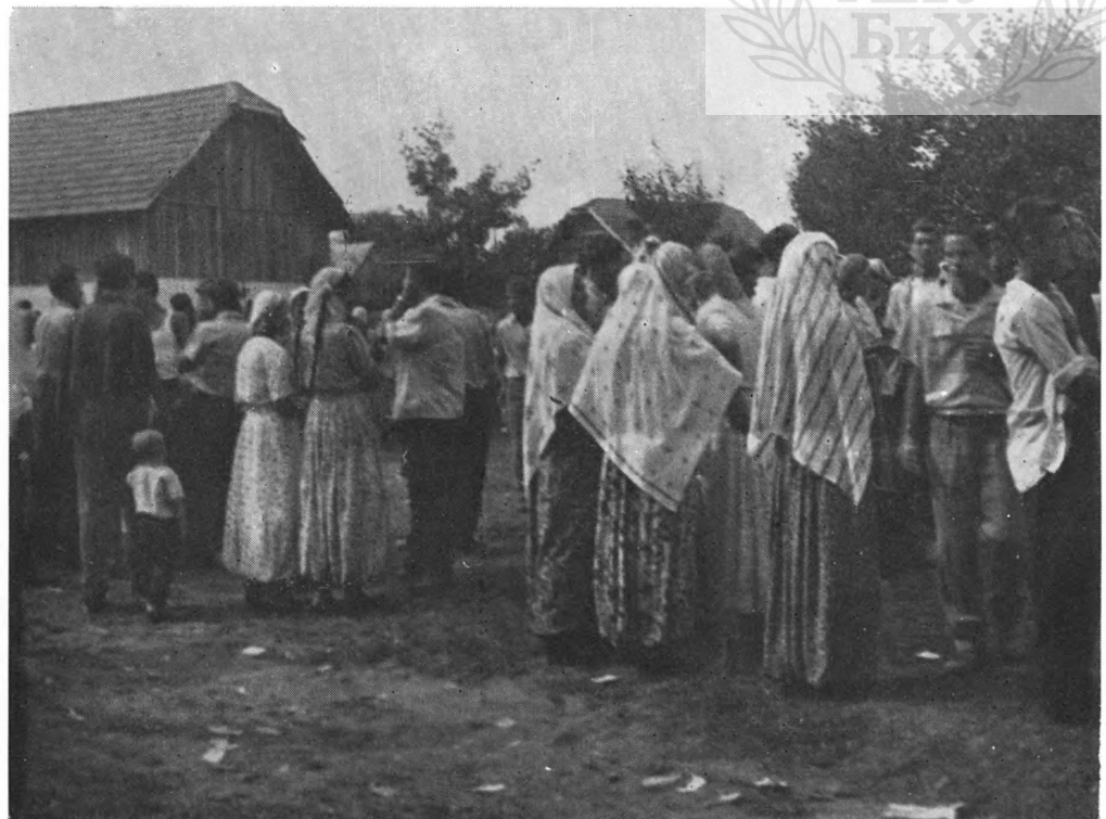
Sl. 4. Muslimanska nošnja, Gromiljak