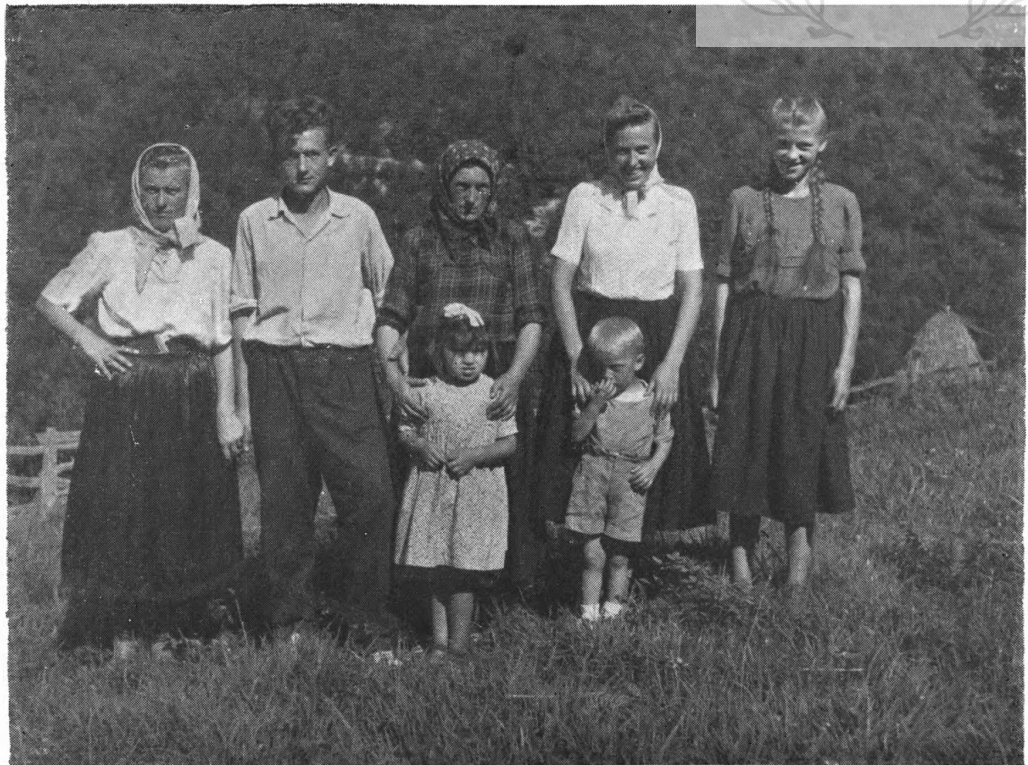
Sl. 8. Savremena srpska nošnja, Mokrine