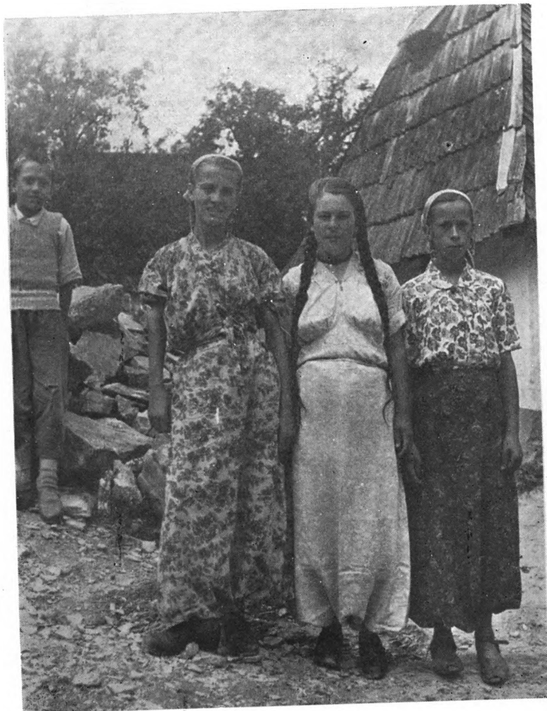
Sl. 5. Muslimanjska devojačka nošnja, Mokrine