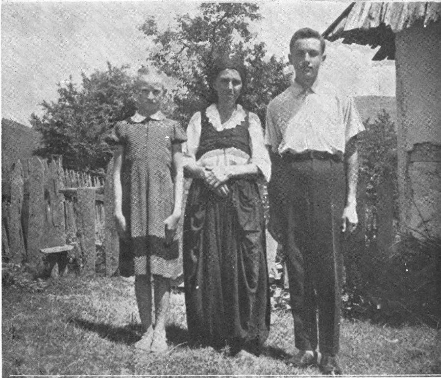
Sl. 3. Hrvatska nošnja, Borna (nošnja udate žene)