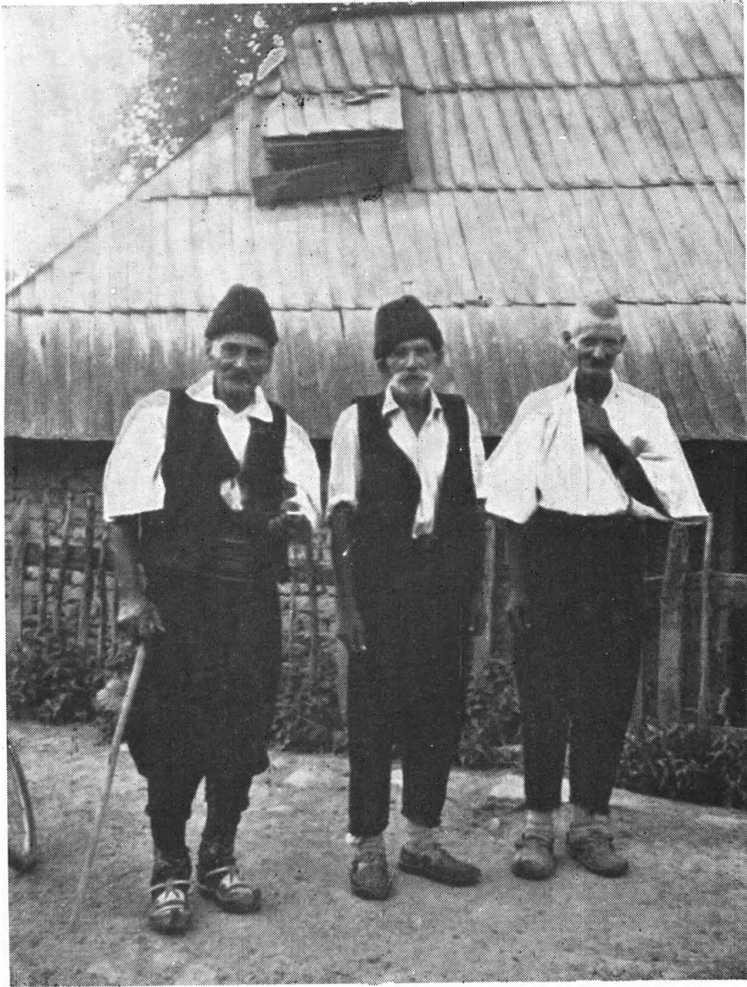
Sl. 7. Starija srpska nošnja, D. Kovači