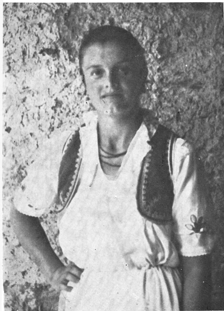
Sl. 1. Hrvatska nošnja, Brnjaci