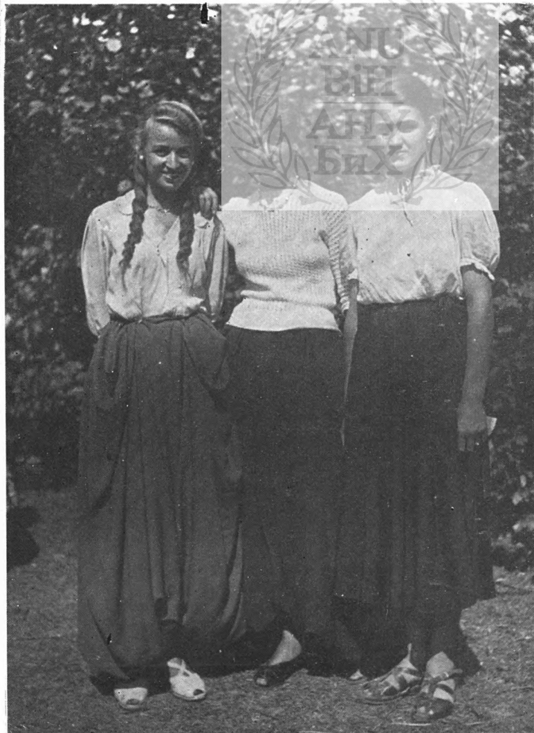
Sl. 2. Hrvatska devojačka nošnja, Borna