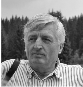
Akademik Sulejman Redžić (1954–2013)

Akademik prof. dr. Sulejman Redžić je dugogodišnji vrhunski i vodeći ekolog u Bosni i Hercegovini, kao stručnjak, kao istraživač i kao edukator. Pri tome treba imati na umu da ekologija zauzima najistaknutije mjesto među disciplinama koje daju pečat cjelokupnoj savremenoj svjetskoj nauci. Autor je velikog broja naučnih radova i saopštenja (preko dvije stotine) u uglednim časopisima i na uglednim skupovima. Zahvaljujući svom naučnom opusu stekao je visok renome u domaćim i stranim naučnim krugovima. U skladu s tim našao se kao jedini predstavnik iz Bosne i Hercegovine među saradnicima džinovskog projekta UN Millenium Ecosystem Assessment, projekta koji je uključivao preko hiljadu istraživača iz gotovo dvjesto država i koji se smatra paradigmatičnim primjerom globalne saradnje naučnih kapaciteta, ujedinjenih u cilju proučavanja i rješavanja zajedničkih egzistencijalno važnih problema iskrslilih pred čovječanstvo.