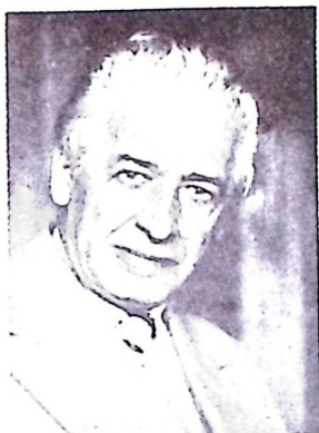
AKADEMIK NEDO ZEC (1889–1971.)

Akademik NEDO ZEC preminuo je 17. novembra 1971. godine.