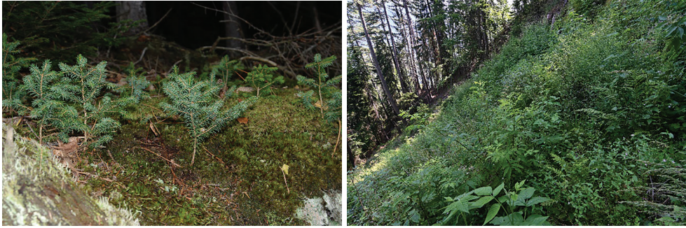
Slike 4–5. Podmladak omorike na lokalitetu Studenac (lijevo) i ogledno polje obraslo korovskom vegetacijom na Tesli (desno) (Đ. Milanović)

Figures 4–5. Serbian spruce sapling on the Studenac site (left) and an experimental field with weed vegetation on Tesla (right) (Đ. Milanović)