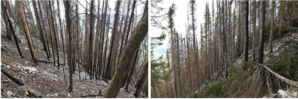
Slike 8–9. Potpuno stradali dijelovi sastojina u požarima 2021. godine na kojima su podignuti ogledi: Gostilja (lijevo) i Veliki Stolac (desno) (Đ. Milanović)

Figures 8–9. Completely damaged parts of the forest stands in the fires 2021, where experiment plots were established: Gostilja (left) and Veliki Stolac (right) (Đ. Milanović)