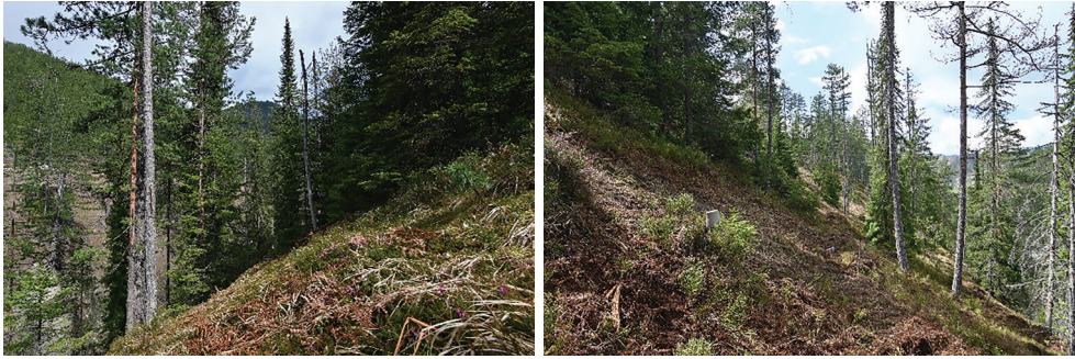
Slike 6–7. Zakorovljena sastojina na Trenicama (lijevo) i izgled očišćenog dijela sastojine na kojem je došlo do obnove omorike (desno) (Đ. Milanović)

Figures 6–7. Site “Trenice” with weed vegetation (left) and cleared part of the stand, where the Serbian spruce was successfully restored (right) (Đ. Milanović)