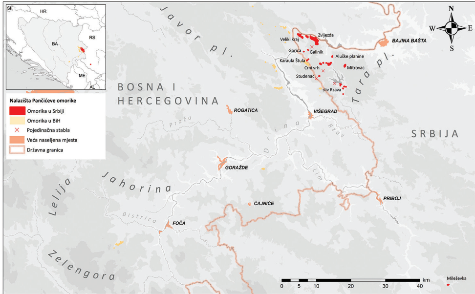
Slika 2. Rasprostranjenje prirodnih sastojina Pančićeve omorike u Srbiji (izvor: Mataruga i Milanović, u štampi)

ima tendenciju jednakosti kroz posmatrano vrijeme, treba naglasiti zapaženu pojavu sušenja, redukcije broja stabala kod “usamljenih” lokaliteta, što s pravom ovu vrstu zadržava u kategoriji ugroženih i zahtijeva intervencije sa ciljem njenog opstanka. Za više podataka o nalazištima omorike u Republici Srpskoj čitalac se upućuje na referencu Mataruga i Milanović (2020). Nalazišta omorike u Srbiji su prikazana na slici 2. Prostorno bliska nalazišta takođe su grupisana u šire toponime.