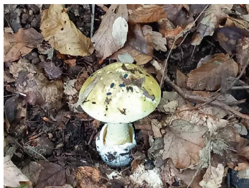
Slika 1. Amanita phalloides (Zelena pupavka), česta gljiva istraživanog područja Picture 1. Amanita phalloides (Death Cap Mushroom) common mushroom of the researched area

Map 1. Location of the researched locality (the map taken from Military geographic institute Belgrade 1982)