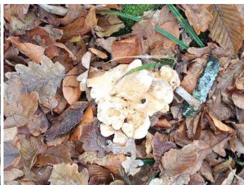
Slika 2. Hydnum repandum (Prosenjak), jedna od posljednjih gljiva na istraživanom području, slika je napravljena 9. XII 2023. Picture 2. Hydnum repandum (Sweet Tooth Mushroom) one of the last mushrooms on researched area, picture was made 9. 12. 2023