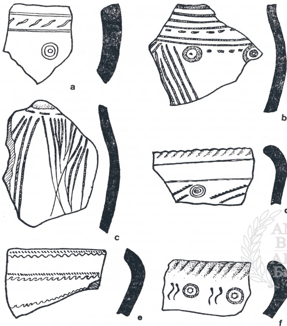
Fig. 2. — Tessons de céramique de Katrište (a), de Kocerinovo (b, c), de Gălăbniak (d), de Negovanci (e) et de Cetirci (f).

C'est probablement de ce fait que la limite occidentale de son aire est fixée dans la vallée de la Struma. Certains auteurs considèrent que ce groupe a exercé une influence sur l'art céramique en Macédoine du Nord-Est au premier âge du Fer. 32 Comme on le sait, la caractéristique du groupe de Cepina est fondée sur le mode de décoration (en particulier, de lignes profondément incisées et par le procédé dit «Furchenstich») qui reconduit des motifs connus au premier âge du Fer. Mais on a laissé de côté le fait que les formes qui en attestent se rapportent à la fin du premier âge du Fer, soit à la période du VI e au IV e s. av. J.-C., fait confirmé par l'étude de la stratigraphie du