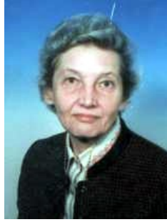
Slavica Krneta (1927–2010)

Prof. dr. Slavica Krneta je rođena 10. novembra 1927. godine u Sarajevu, gdje je završila osnovnu školu i gimnaziju. Diplomirala je na Pravnom fakultetu Univerziteta u Sarajevu 1953. godine. Nakon završetka studija dvije godine je radila kao sudski pripravnik, a potom i sudija Sreskog suda u Sarajevu. Od 1. januara 1956. godine profesorica Krneta počinje raditi u zvanju asistenta na Pravnom fakultetu Univerziteta u Sarajevu. Na istom fakultetu 12. decembra 1963. godine odbranila je doktorsku disertaciju pod naslovom „Uloga i značaj posjeda u našem pravu“. Područje akademskog zanimanja profesorice Krneta je obuhvatalo discipline Građansko pravo i Autorsko pravo sa pravom industrijskog vlasništva. Tako, je profesorica Krneta 22. aprila 1964. godine izabrana za docenta, 26. januara 1970. godine za vanrednog profesora, a u novembru 1977. godine profesorica dr. Slavica Krneta izabrana je u zvanje redovnog profesora. Cjelokupno univerzitetsko djelovanje profesorice Krnete vezano je za Pravni fakultet Univerziteta u Sarajevu. Godine 1986. profesorica Krneta je izabrana za dekana Pravnog fakulteta Univerziteta u Sarajevu. Odlukom Rektorata Univerziteta u Sarajevu, 2005. godine dodijeljeno joj je počasno zvanje profesor emeritus. Za dopisnog člana Akademije nauka i umjetnosti Bosne i Hercegovine izabrana je 2002. godine, a za redovnog člana 2005. godine.