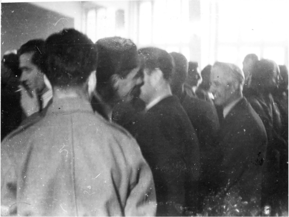
Treće zasjedanje ZAVNOBiH-a, čestitanja ministrima

Na kraju zasjedanja usvojen je Zakon o izmjeni člana 2. Odluke ZAVNO-BiH-a o stvaranju Zakonodavnog odbora od 1. jula 1944. Član 2 Odluke Zemaljskog antifašističkog vijeća narodnog oslobođenja Bosne i Hercegovine o stvaranju Zakonodavnog odbora mijenja se i glasi: "Zakonodavni odbor sačinjavaju predsjednik, i deset članova koje bira iz svoje sredine Narodna skupština Bosne i Hercegovine. Ovaj zakon stupa na snagu odmah.