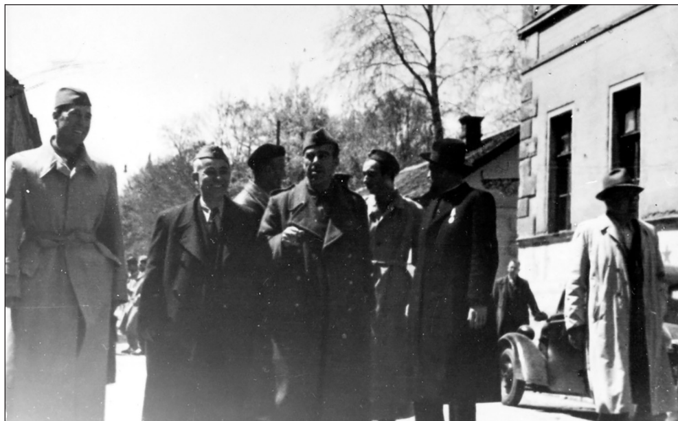
Početak zasjedanja ZAVNOBiH-a