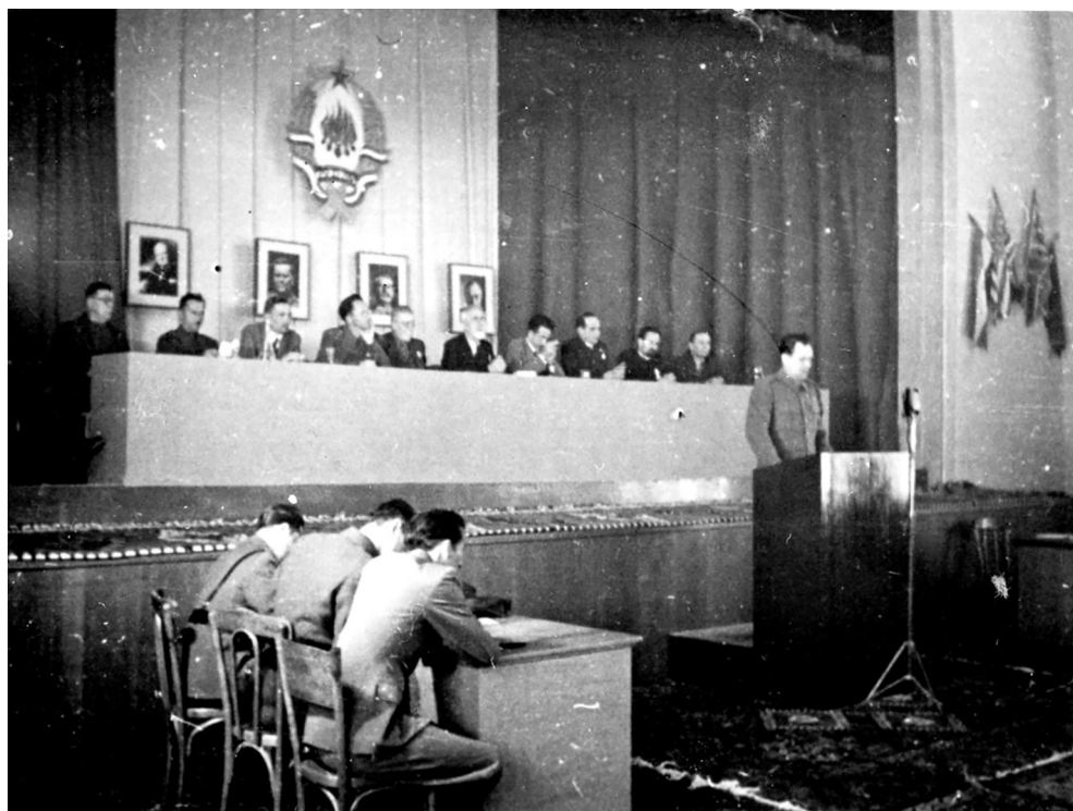
Rodoljub Čolaković čita politički izvještaj

U popodnevnom nastavku sjednice slijedilo je izlaganje prijavljenih diskutanata. Mujbeg Rustenpašić, narodni poslanik iz Gradačca navodio je uspjehe i zasluge Jugoslavenske Armije.