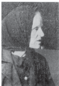
Soja Čopić Treće zasjedanje ZAVNOBiH-a, Narodna štamparija, 1955, 81.

Ignjat Marić, težak iz Blagaja, član Sreskog NOO-a je rekao: “Kako god je naš narod bio osnovna snaga za vođenje rata kroz ove četiri godine, isto tako on mora da bude osnovna poluga za podupiranje i davanje svake pomoći i podrške našoj narodnoj vladi koju ćemo izabrati. Samo na taj i takav način vlada će moći pravilno da rukovodi i pravilno da izvršava sve odluke i ono što je u interesu naših naroda”.