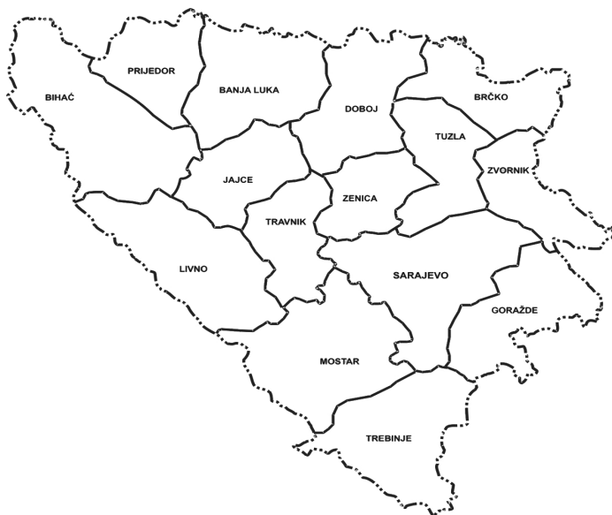
Karta: Podjela BiH na srezove 1963. godine (Izvor: Osmanković, J. i Pejanović, M., 2009:135)

Bosna i Hercegovina je 1959. godine imala 134 opštine. Do 1961. godine broj opština je smanjen na 122. Do 1992. godine broj opština u Bosni i Hercegovini je sveden na 109. Ustavom Socijalističke Federativne Republike Jugoslavije iz 1963. godine uspostavljen je jedinstven komunalni sistem u cijeloj državi u kome je opština ustavno definisana kao osnovna društveno-politička zajednica. Preko opštine se ostvaruju sve funkcije društva, osim onih koje su Ustavom date u nadležnost širih društveno-političkih zajednica. Prema odredbama Ustava SFRJ u opštini se osiguravaju uslovi za rad ljudi i stvaraju uslovi za zadovoljavanje socijalnih, materijalnih, kulturnih i drugih zajedničkih interesa. U opštini se osiguravaju uslovi za zaštitu sloboda i prava građana i organizuju organi vlasti i društvene službe od zajedničkog interesa. Prava i dužnosti opštine utvrđeni su, pored Ustava, zakonom i statutom. Ustavom SFRJ iz 1963. godine republikama je data mogućnost da preko svojih zakonodavnih ovlaštenja mogu utvrditi da u republikama postoje samo opštine kao jedinice lokalne samouprave. Republike su samostalno utvrđivale nad-