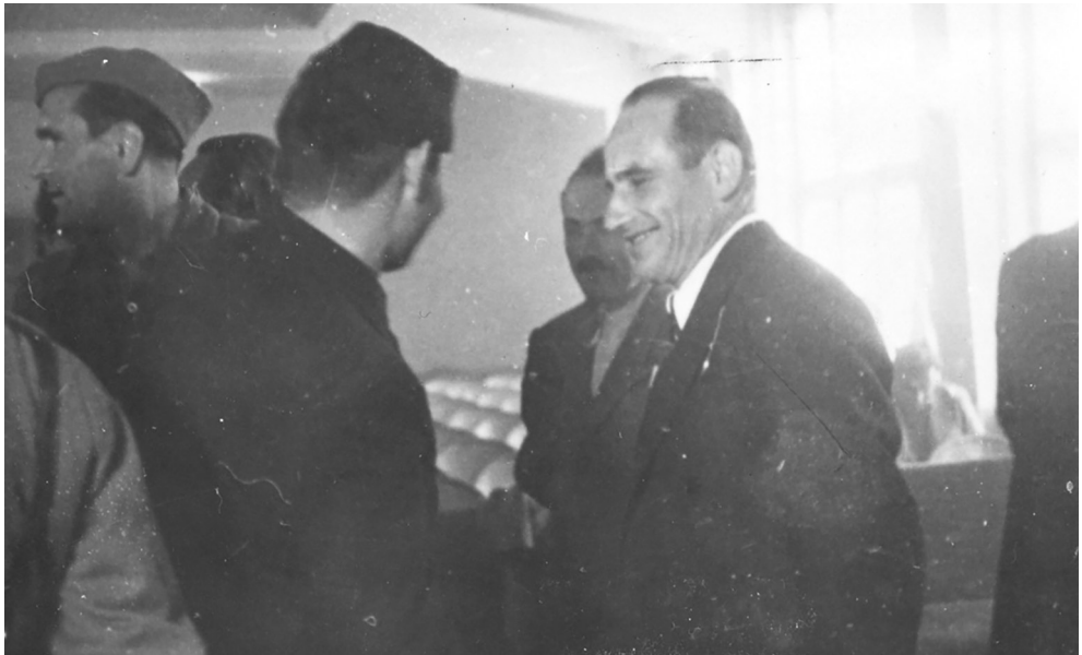
Treće zasjedanje ZAVNOBiH-a, čestitanja ministrima