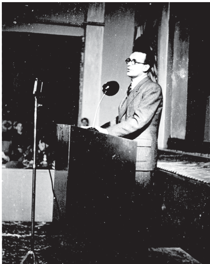
Narodni poslanik Hamdija Ćemerlić