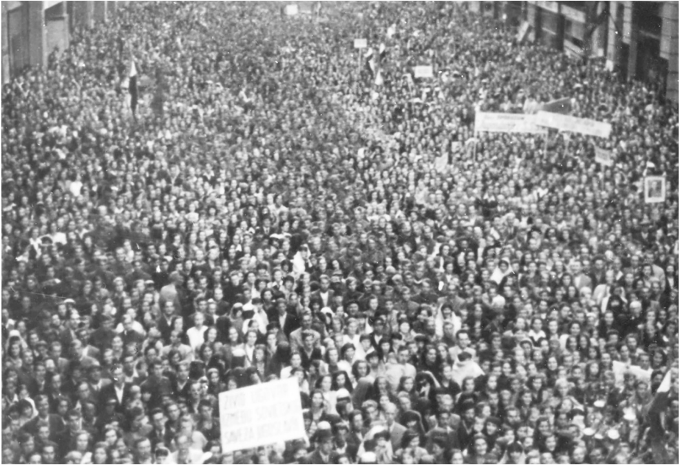
Miting u Sarajevu povodom proglašenja prve vlade, 28. aprila 1945. godine (Zbirka fotografija. ZAVNOBiH. Historijski muzej Bosne i Hercegovine, Sarajevo; Inv.br. 14287)