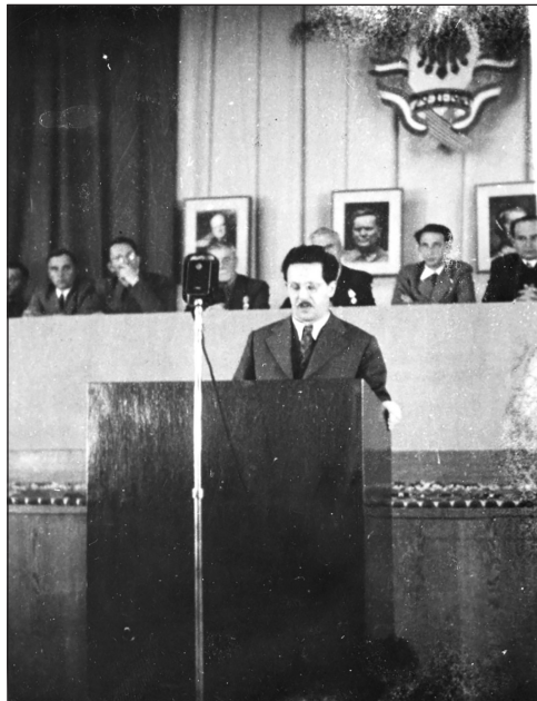
Izlaganje Edvarda Kardelja (Zbirka fotografija, ZAVNOBiH, Historijski muzej Bosne i Hercegovine, Sarajevo; Inv. br. 14358)

Nakon otvaranja zasjedanja slijedio je govor Edvarda Kardelja, potpredsjednika Savezne vlade i ministra za Konstituantu.