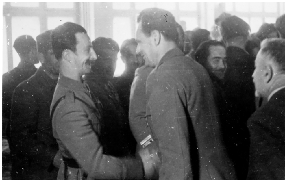
Treće zasjedanje ZAVNOBiH-a, čestitanja ministrima (Zbirka fotografija ZAVNOBiH, Historijski muzej Bosne i Hercegovine, Sarajevo, Inv. br. 14293)