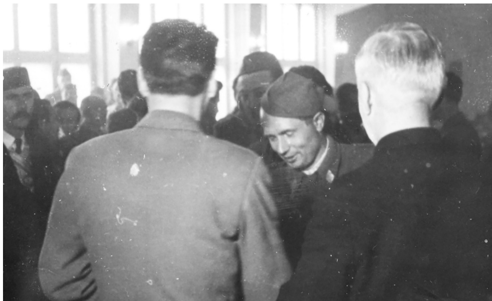
Treće zasjedanje ZAVNOBiH-a, čestitanja ministrima (Zbirka fotografija ZAVNOBiH. Historijski muzej Bosne i Hercegovine, Sarajevo; Inv.br. 14286)