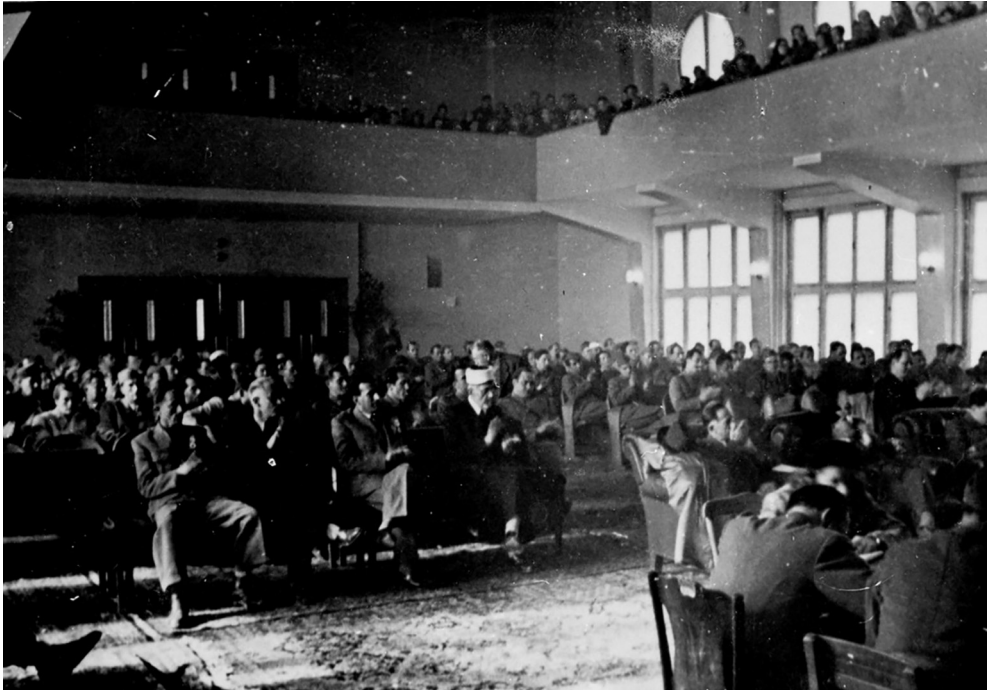
Treće zasjedanje ZAVNOBiH-a (Zbirka fotografija ZAVNOBiH, Historijski muzej Bosne i Hercegovine, Sarajevo; Inv. br. 14377)