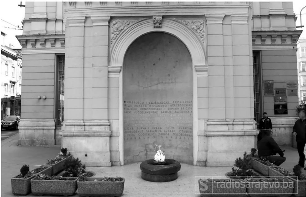
Vječna vatra, www.radiosarajevo.ba