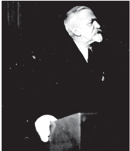
Dr. Vojislav Kecmanović pozdravlja goste

Tačno u 9 sati Predsjednik ZAVNOBiH-a Vojislav Kecmanović je pozdravio goste i otvorio zasjedanje.