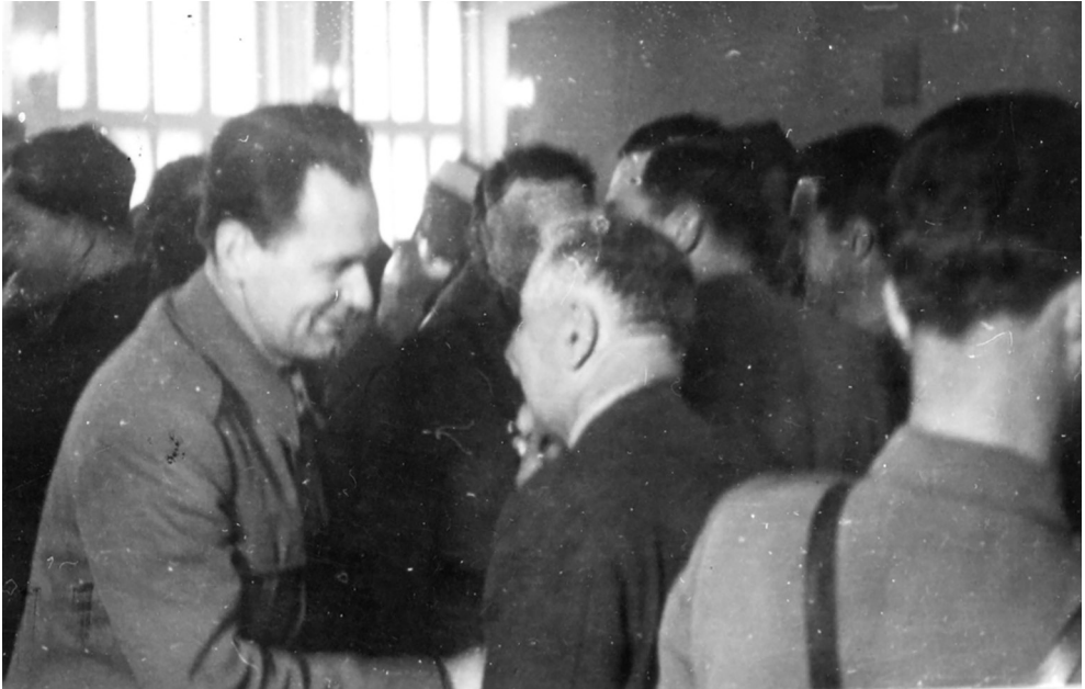
Treće zasjedanje ZAVNOBiH-a, čestitanja ministrima (Zbirka fotografija. ZAVNOBiH. Historijski muzej Bosne i Hercegovine, Sarajevo, Inv.br. 14295)