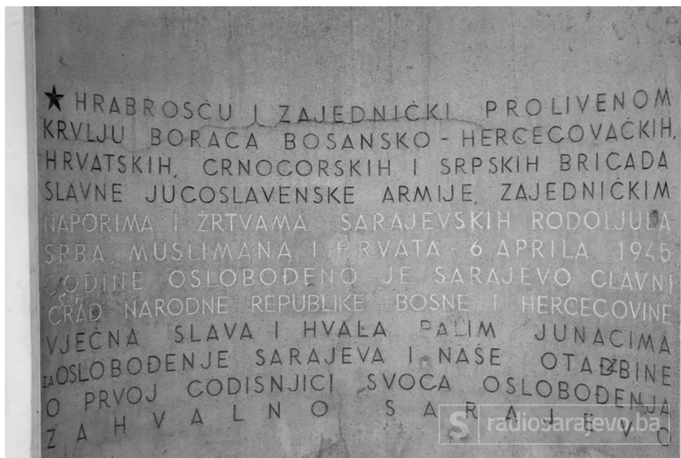
Vječna vatra