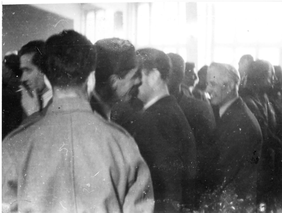
Treće zasjedanje ZAVNOBiH-a, čestitanja ministrima

Na kraju zasjedanja usvojen je Zakon o izmjeni člana 2. Odluke ZAVNO-BiH-a o stvaranju Zakonodavnog odbora od 1. jula 1944. Član 2 Odluke Zemaljskog antifašističkog vijeća narodnog oslobođenja Bosne i Hercegovine o stvaranju Zakonodavnog odbora mijenja se i glasi: "Zakonodavni odbor sačinjavaju predsjednik, i deset članova koje bira iz svoje sredine Narodna skupština Bosne i Hercegovine. Ovaj zakon stupa na snagu odmah.