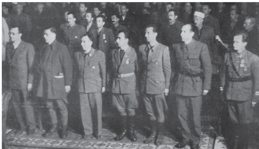
Narodni poslanici polažu zakletvu

Treće zasjedanje ZAVNOBiH-a, Narodna štamparija, 1955, 113.