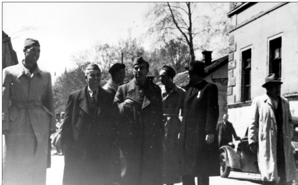
Početak zasjedanja ZAVNOBiH-a