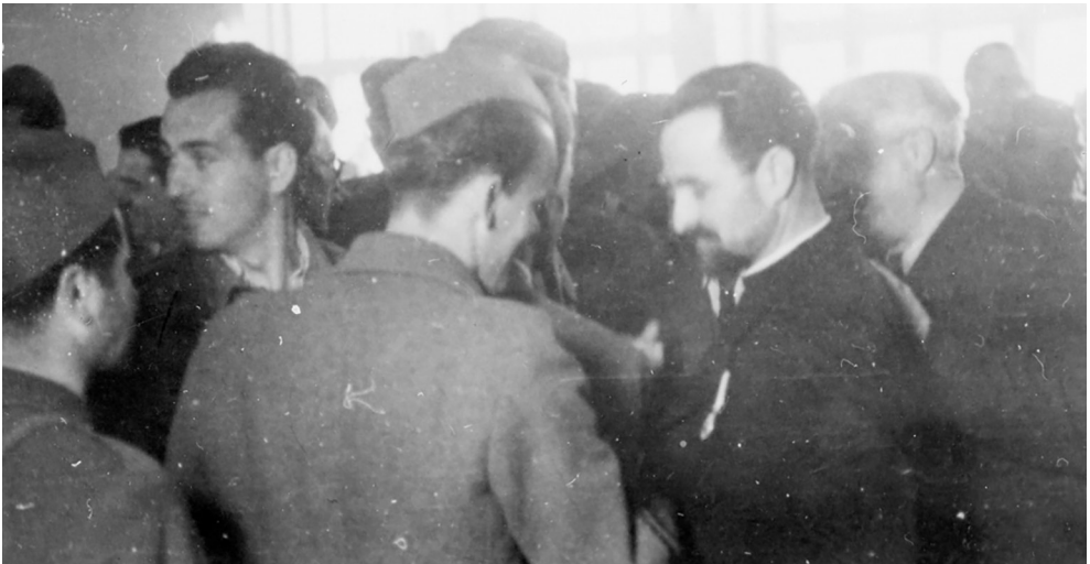
Treće zasjedanje ZAVNOBiH-a, čestitanja ministrima (Zbirka fotografija. ZAVNOBiH. Historijski muzej Bosne i Hercegovine, Sarajevo; Inv.br. 14287)

Nakon proglašenja Vlade Bosne i Hercegovine, uslijedila su brojna čestitanja.