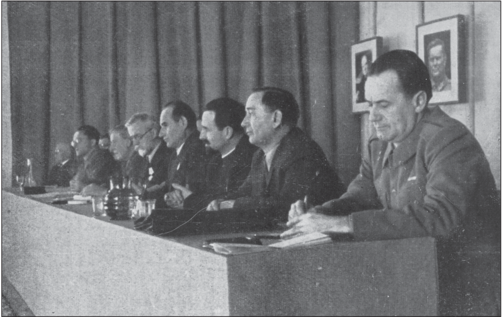
Predsjedništvo Trećeg zasjedanja ZAVNOBiH-a

Tačno u 9 sati Predsjednik ZAVNOBiH-a Vojislav Kecmanović je pozdravio goste i otvorio zasjedanje.