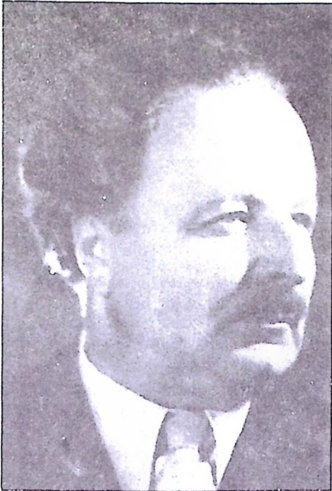
DRAGOMIR ĆOSIĆ (13. X 1896 – 22. XII 1977)

Rođen je 13. oktobra 1896. god. u Velikoj Drenovi (Srbija). Sticao je dosta mješovito srednje obrazovanje: dijelom u Kruševcu, do pred kraj VI razreda gimnazije, dijelom u Skoplju u II i III razredu učiteljske škole, da bi ovaj dio školovanja maturskim ispitom završio za vrijeme I svjetskog rata u srpskoj školi u Nici, u Francuskoj, gdje je bio evakuisan iz armije iz Soluna kao rekonvalescent poslije povlačenja preko Albanije. Redovne agronomske studije završio je kao stipendista francuske države na Velikoj školi za agrikulturu u Grinjonu (1919). Jednogodišnju užu specijalizaciju obavio je poslije položenog diplomskog u Institutu za selekciju i sjemenarstvo u Brnu, u Čehoslovačkoj, školske 1921./22. godine. Godine 1924. prijavio je doktorsku tezu na Prirodno-matematičkom fakultetu (Sciences) u Nansiju, upisao potrebne semestre za pripremu teze i odbranio tezu 1927. godine.